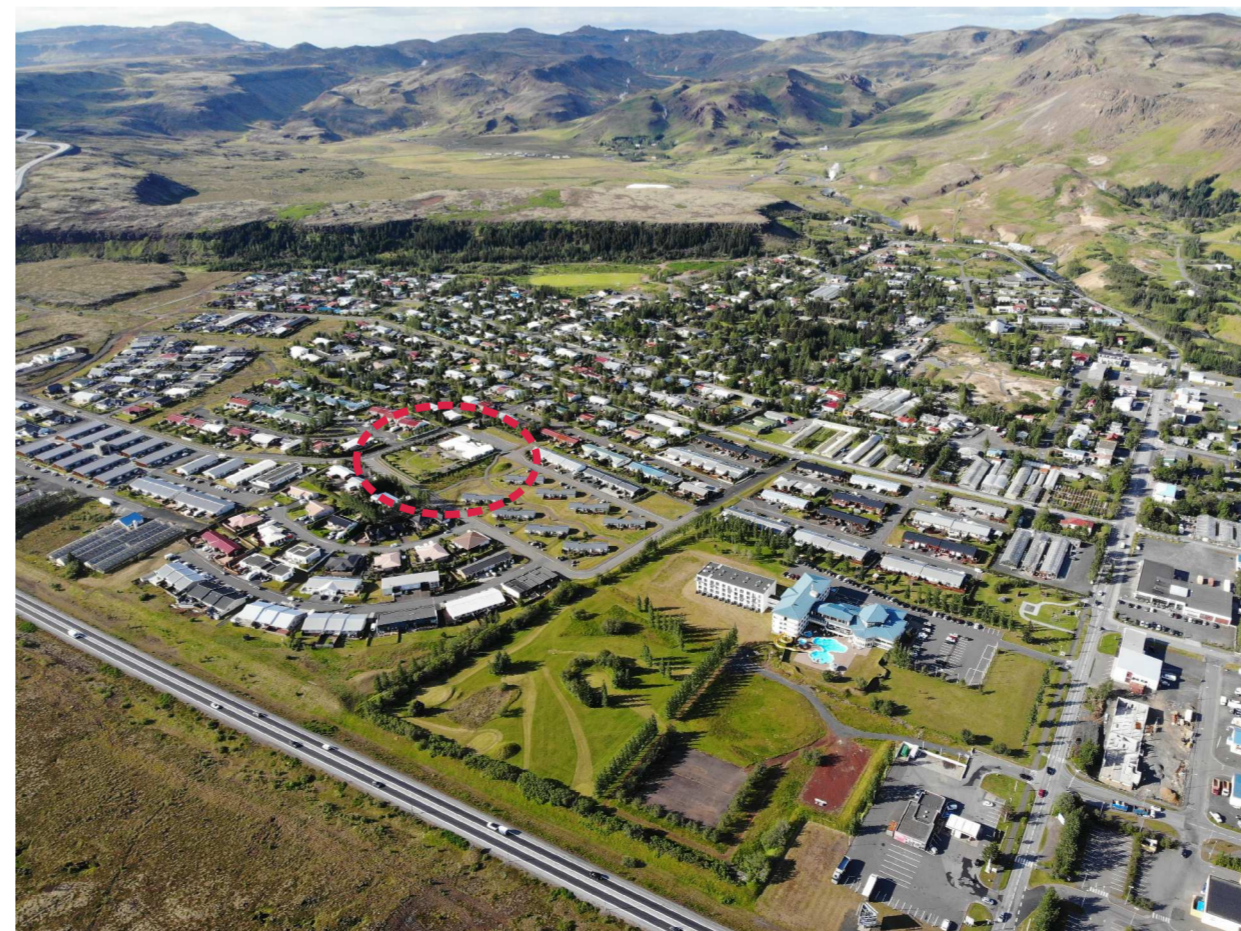
Hveragerði vestan við Breiðumörk

Umverfisáhrif breytingarinnar eru talin óveruleg. Hagræn og samfélagsleg áhrif eru jákvæð, þar sem hægt er að byggja við núverandi leikskóla og stækka leikskólalóð í stað þess að ráðast uppbyggingu nýs leikskóla á öðrum stað. Yfirbragð byggðar helst óbreytt. Svæðið sem breyting nær verður áfram að hluta til grænt svæði sem nýttist aðliggjandi íbúðarbyggð utan opnunartíma leikskólans.