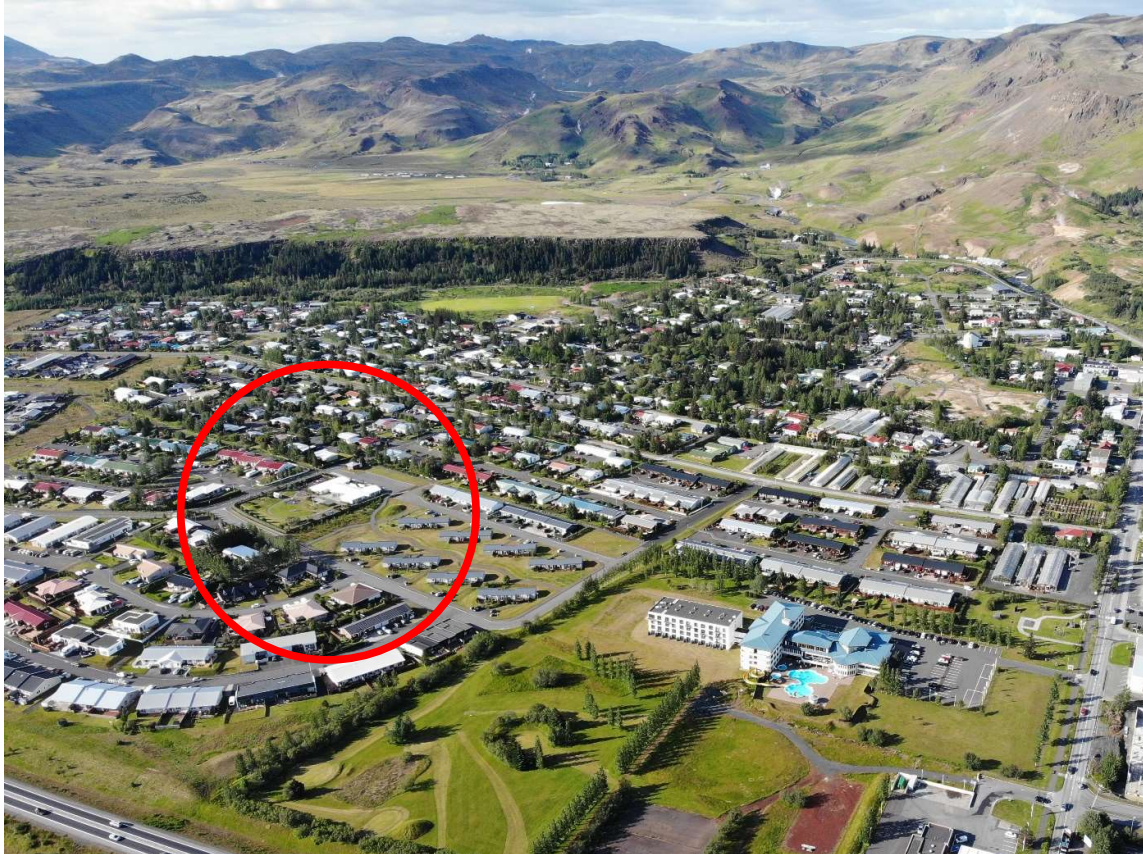
Mynd 1 – Flugmynd frá 2020 sýnir hvar leikskólinn Óskaland er í Hveragerði.

Hér er sett fram skipulags- og matslýsing fyrir breytingu á aðalskipulagi Hveragerðisbæjar 2017-2029 á reitnum S2 og aðliggjandi reit OP. Lýsingin er unnin skv. gr. 5.2 í skipulagsreglugerð nr. 90/2013 og er ætlað að tryggja aðkomu hagsmunaaðila og almennings að skipulagsferlinu.