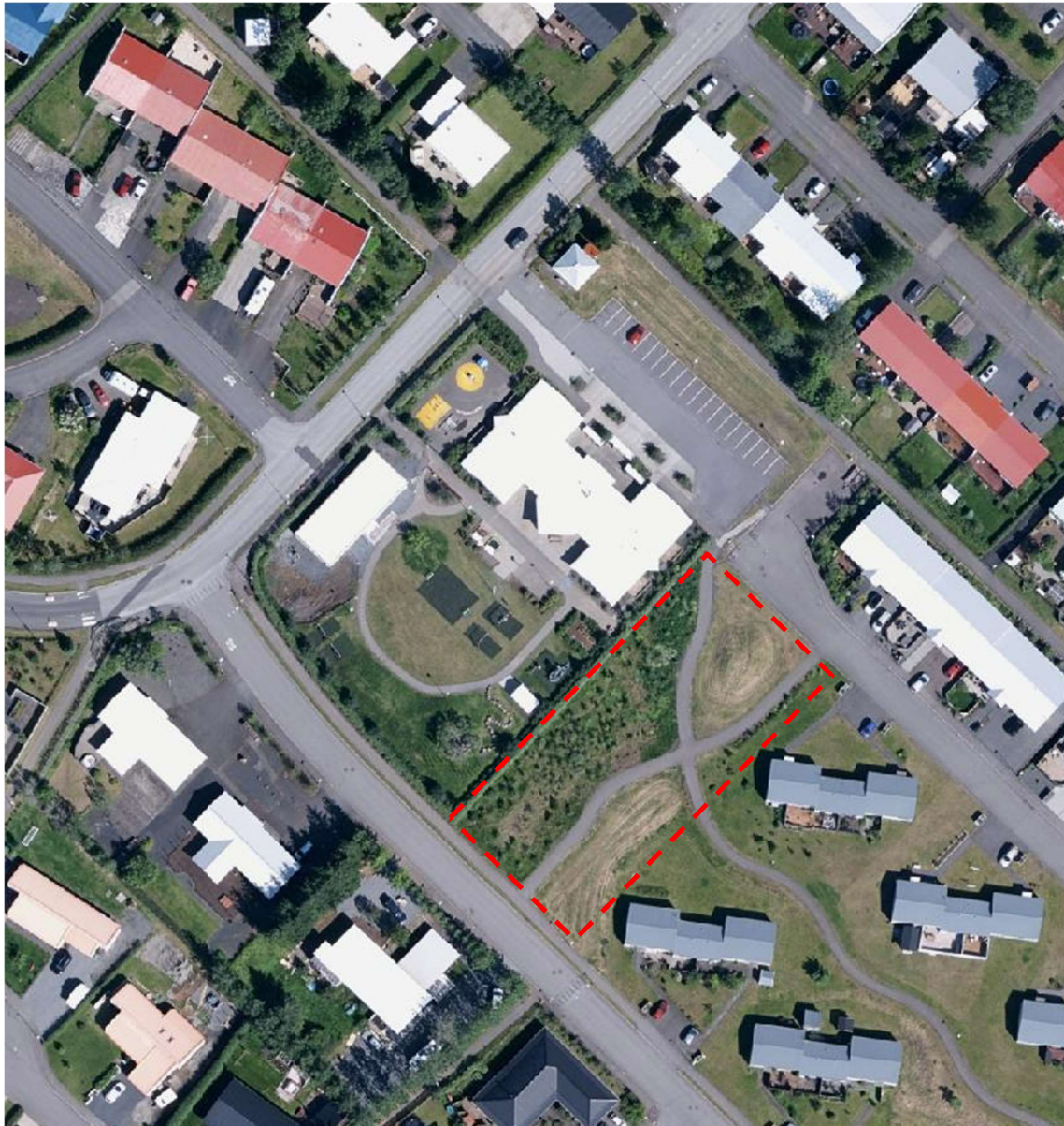
Mynd 2 – Loftmynd, rauð brotin lína sýnir opið svæði (OP) austan við leikskólalóðina (S2).