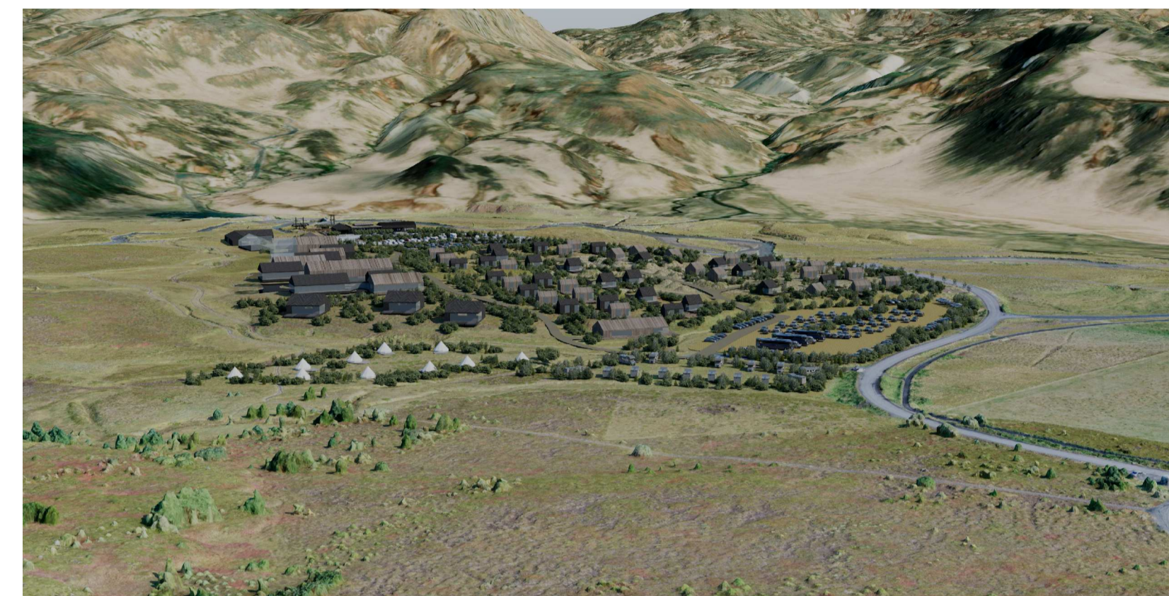
Skýringamynd, horft frá Kömbum til norðausturs © Studio A Schram