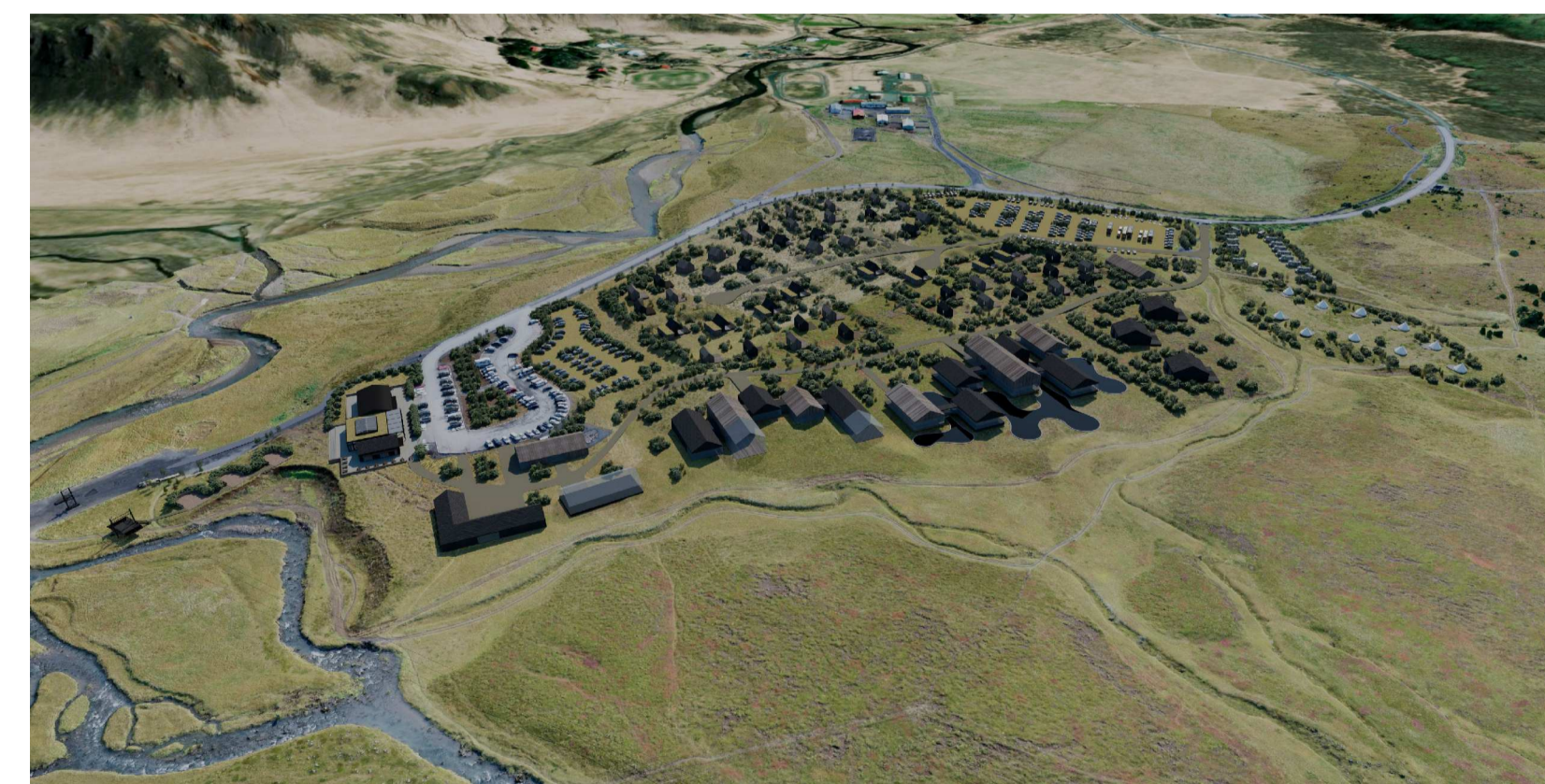
Skýringamynd, frá lofti