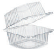
Plastbakkar með loki