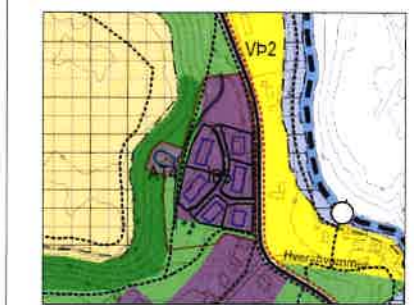
Svæðið sýnt á úrklippu úr aðalskipulagi Hveragerðisbæjar 2017-2029