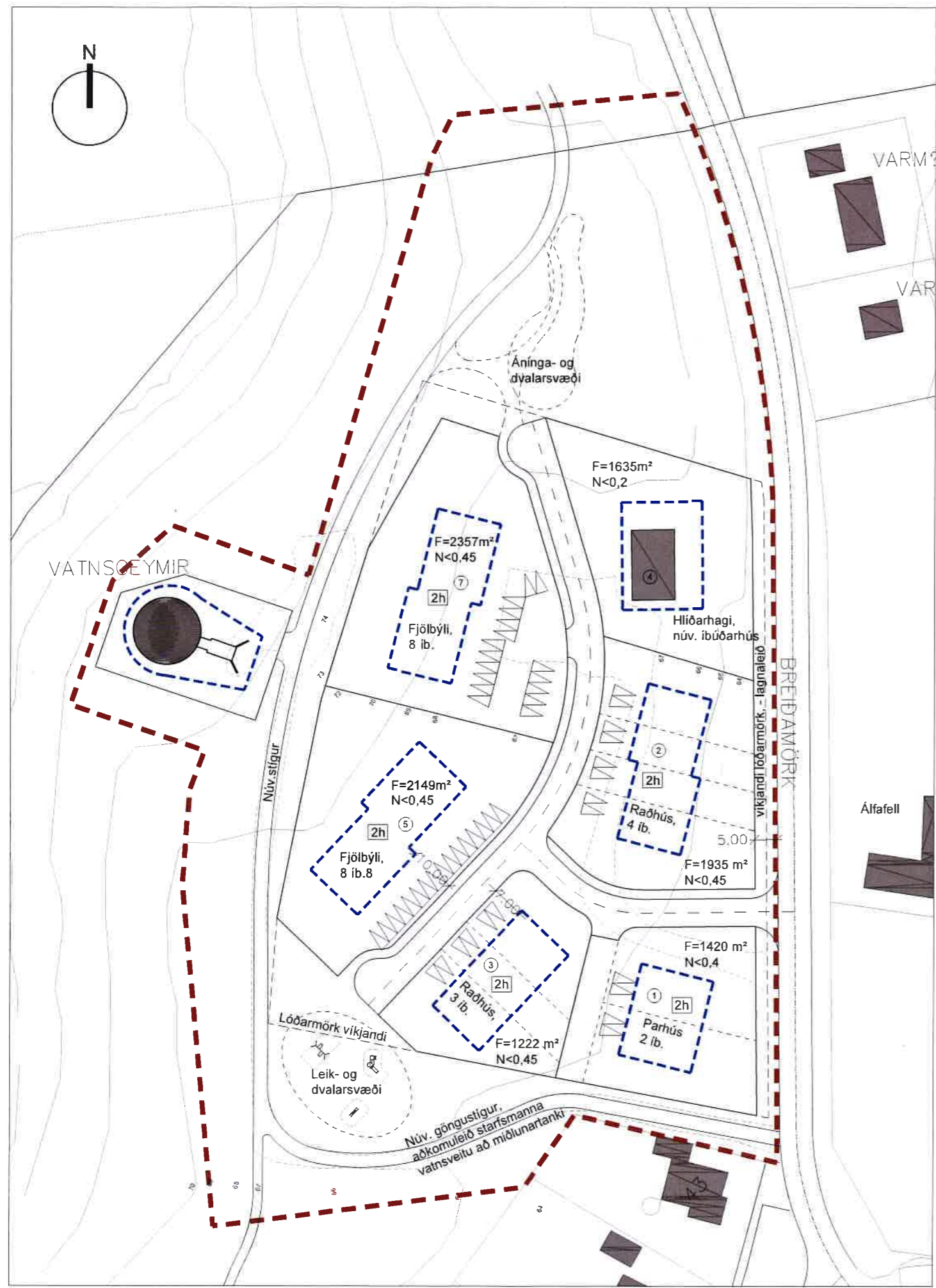
Deiliskipulag, mkv. 1:500